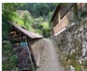
斜面に立つ家なみ

10:00中川自治会館前出発⇒中川八幡宮(樹齢600年の北山杉の母樹) ⇒木造倉庫群(丸太磨き体験)⇒路地裏の古民家見学⇒大台杉⇒古民家見学(中川伝統の納豆もち試食)⇒12:50頃終了