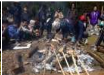
魚の串刺し焼き(ひのさい)

大好評の小学生向け林業体験メニューを一般向けにアレンジ。 美観の台杉林の中で、世界一の美と品質を誇る北山磨丸太の生産工程を地元林業家 といっしょに体験します。 作業した後は、山であぶって食べる焼き魚、おにぎりをいただきます。