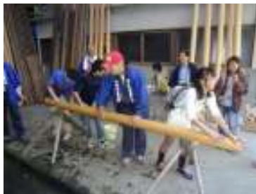
丸太倉庫での磨き丸太体験