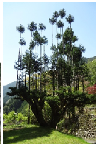
世界唯一の巨大台杉

倉庫や古民家が傾斜地に建ち並ぶ中川集落のみどころをご案内します。 木造倉庫では、丸太磨きを地元女性が実演した後、みなさんにも体験をしていただきます。 散策の後は古民家のお食事処で昼食をどうぞ。