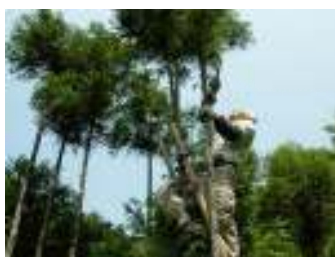
北山台杉の枝打ち

10:00中川自治会館前出発⇒北山台杉林にて伐採、枝打ち、皮むき、丸太磨きなどの林業体験 ⇒12:50解散